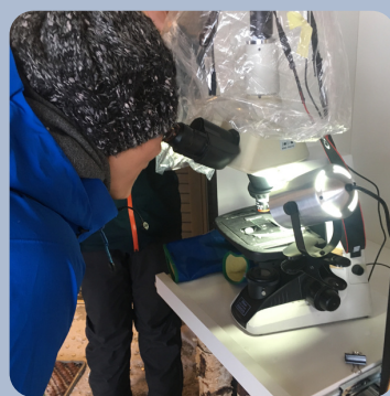
雪の結晶観察会 Snow crystal Observation