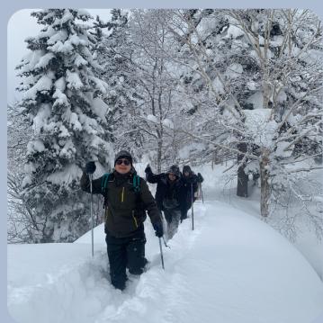
スノーシュー体験 Snow shoe Hiking

プログラム ※内容は天候などにより変更または中止の場合がありますので、予めご了承ください。