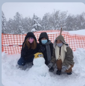
雪遊び Playing with snow